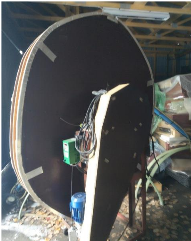
Laskutelineen kelausmuotti (1/4)