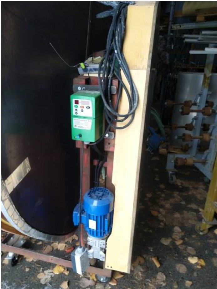
Laskutelineen kelausmuotti (3/4)