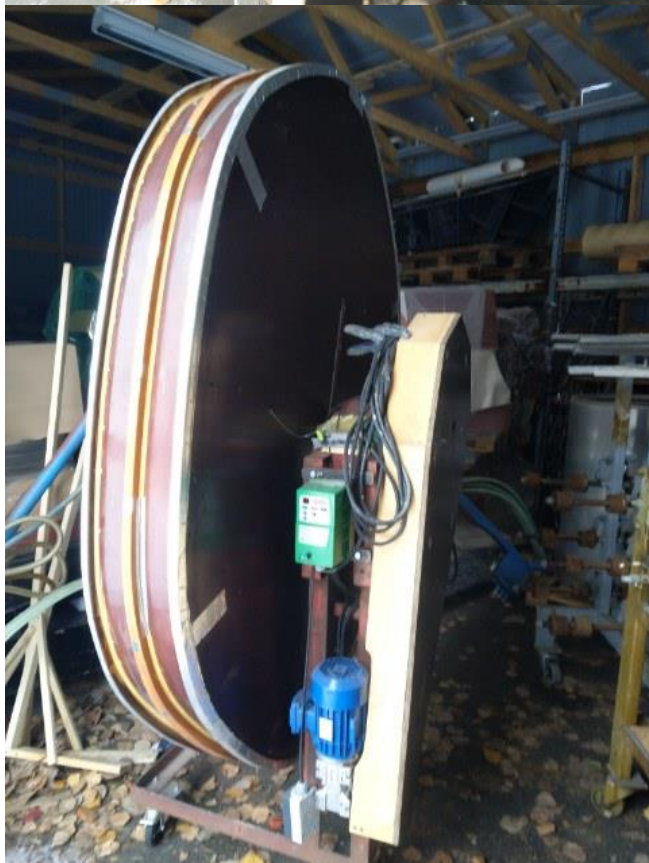
Laskutelineen kelausmuotti (2/4)