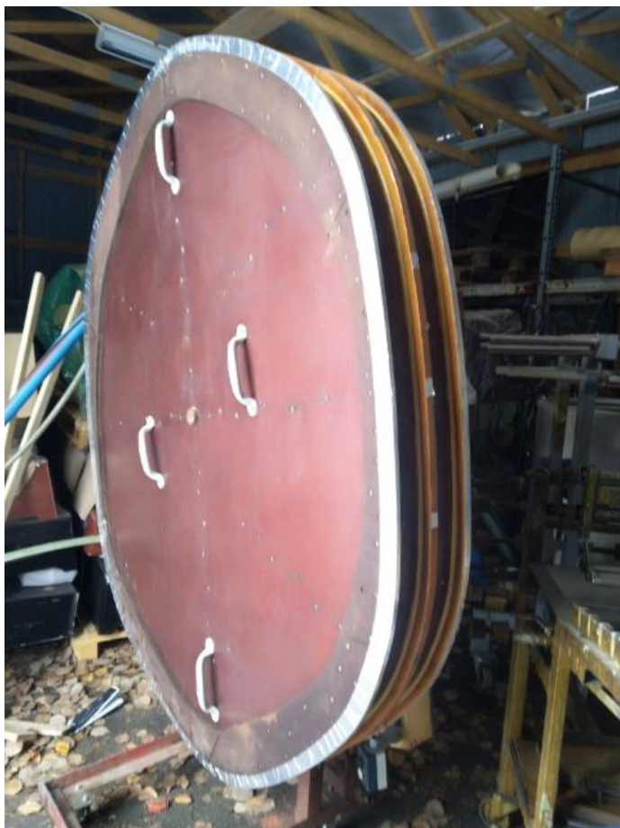
Laskutelineen kelausmuotti (4/4)