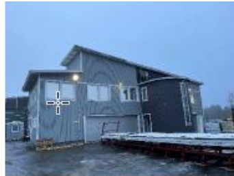
Tuotantohalli 1 pääty